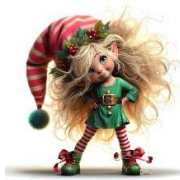
Das Wichtel Lied

UM IN DIE RICHTIGE WEIHNACHTSSTIMMUNG ZU KOMMEN, BRAUCHT ES NATÜRLICH AUCH DIE RICHTIGE MUSIK. ALSO HABEN WIR DIE „LYRICS“ EINES BEKANNTEN UND EINES EHER WENIGER BEKANNTEN LIED RAUSGESUCHT.